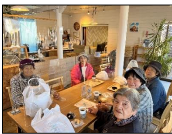
【にこにこ会の皆さま】

団体予約は会員番号・お名前が わかれば代表者様からの お電話にてご予約いただけます。